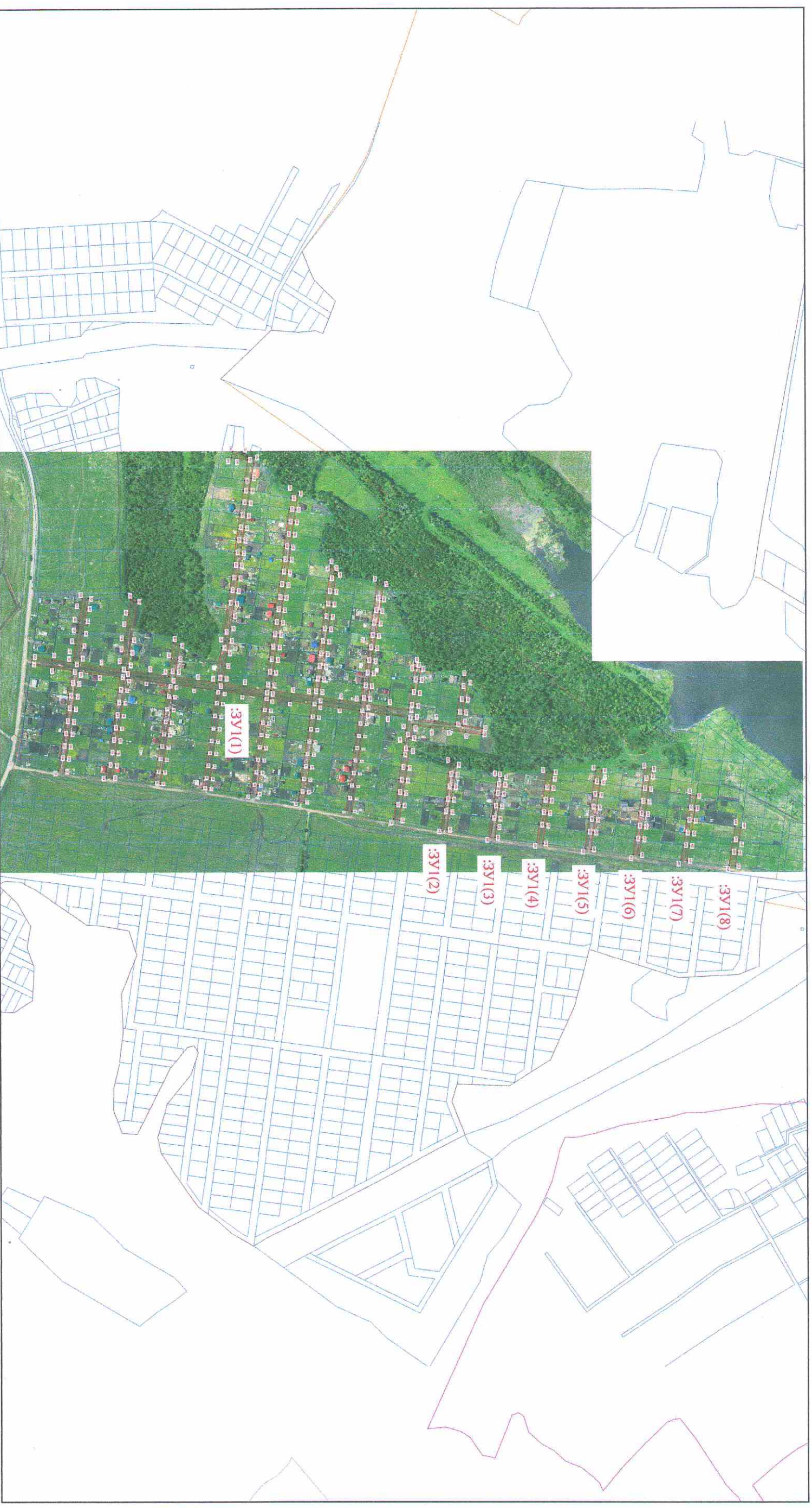
Схема расположения земельных участков на кадастровом плане территории